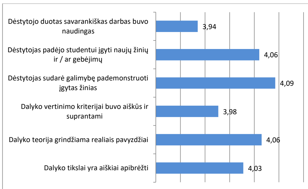
1 pav. Studijų programos Kibernetinės sistemos ir sauga dalykų turinio kokybės vertinimas pagal šešis kriterijus (vidurkiai)

Studijų programos Kibernetinės sistemos ir sauga dalykų turinio kokybės įvertinimų vidurkis yra 4,03 (žr. 1 pav.)