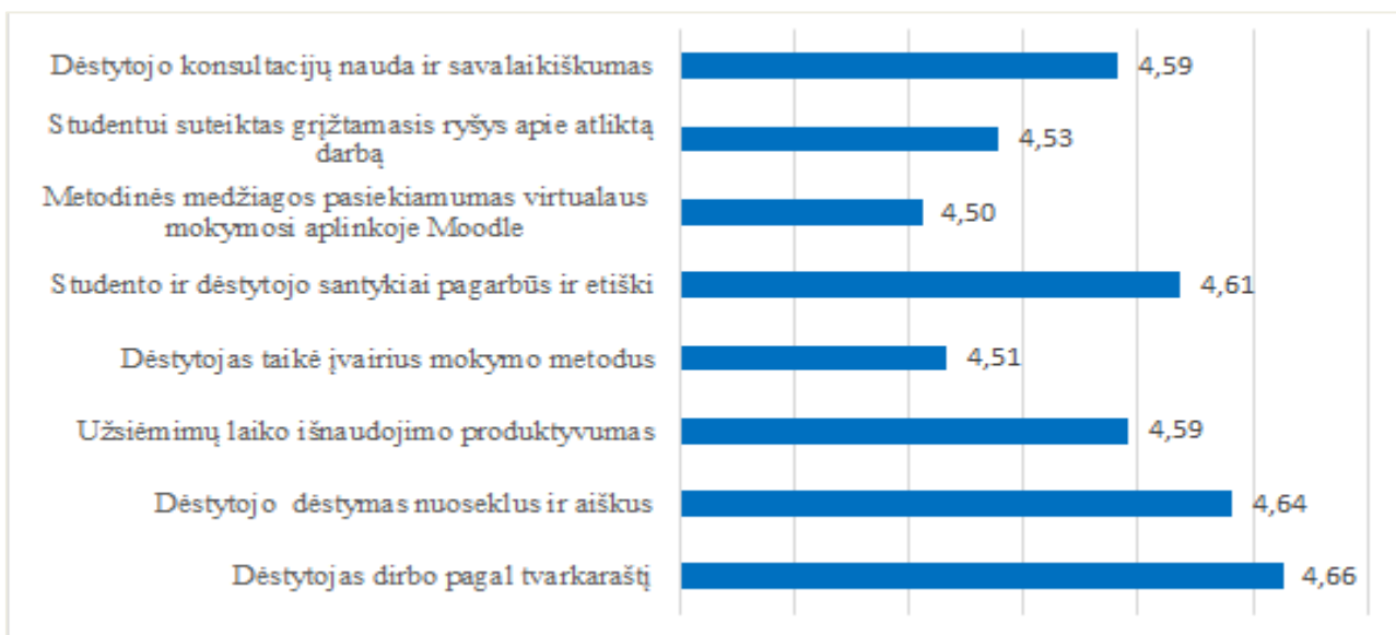
2 pav. Agroverslų technologijų studijų programos dalykų dėstytojų kokybės vertinimas pagal aštuonis kriterijus (vidurkiai)

Agroverslų studijų programos dalykų dėstytojų kokybės įvertinimų vidurkis yra 4,58 (žr. 2 pav.).