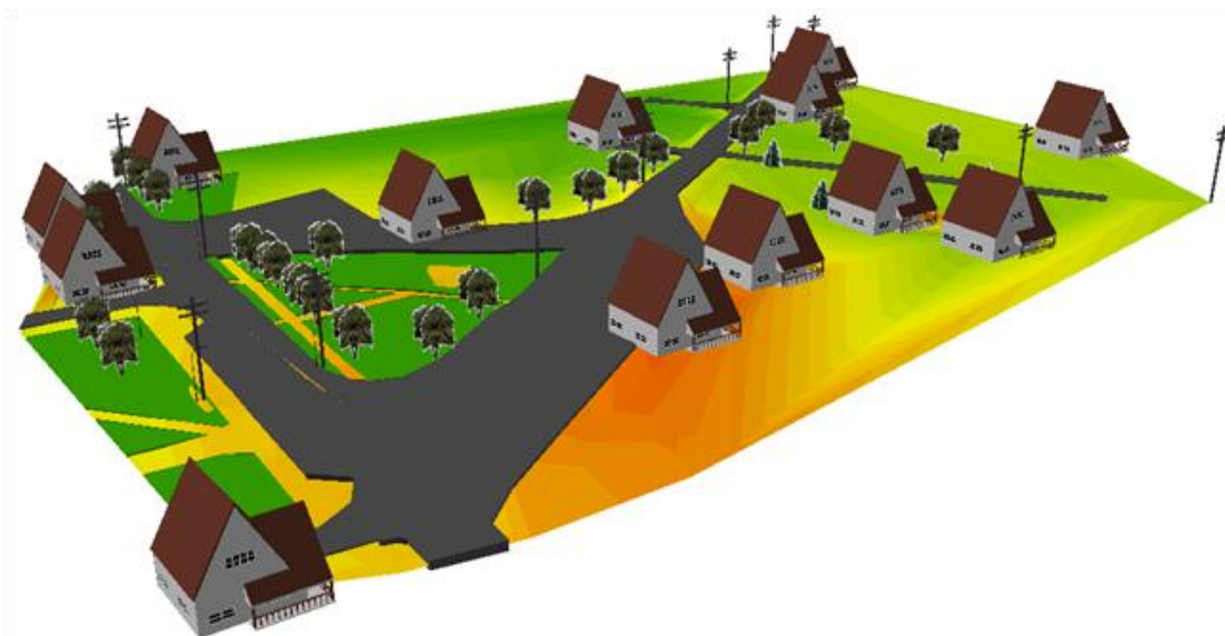
3.12 pav. Topografinio plano skaitmeninis 3D modelis