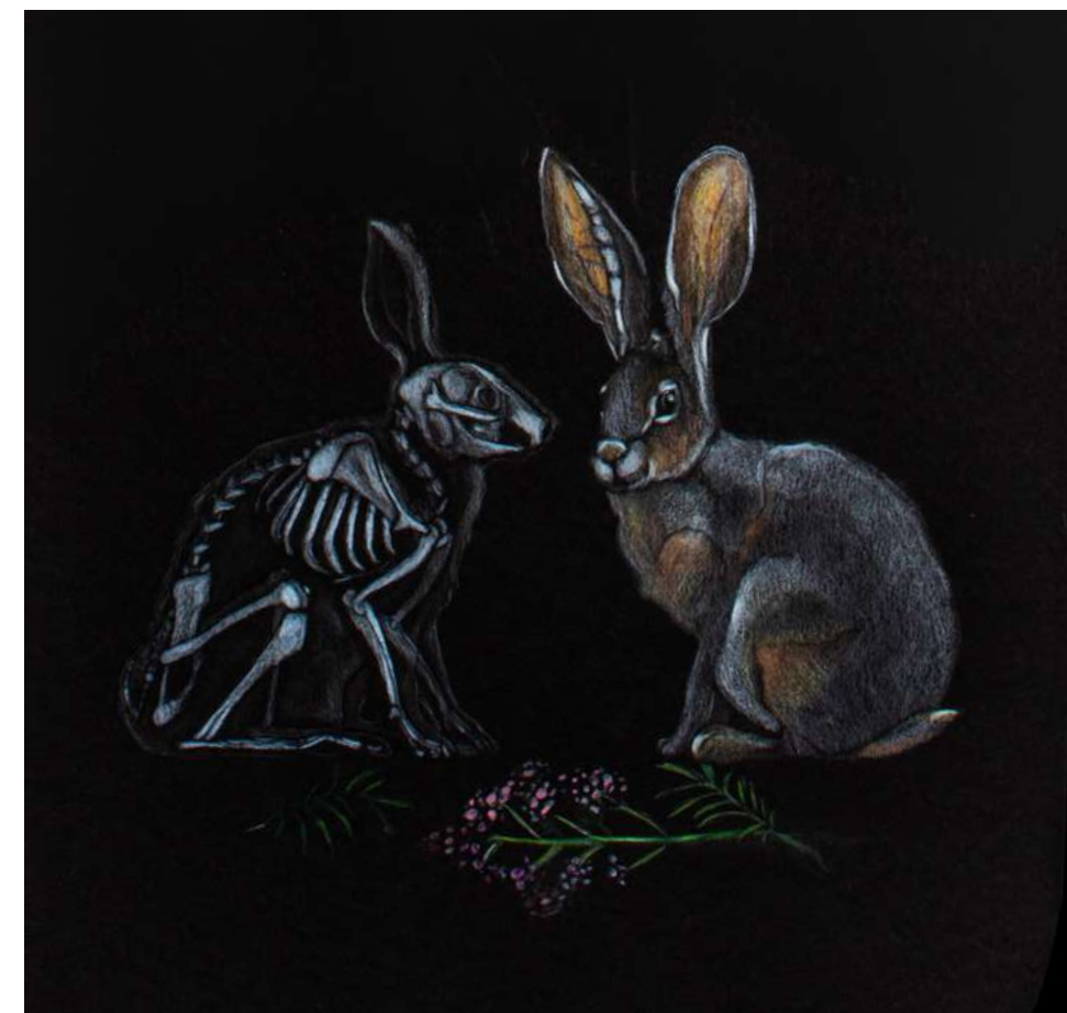
DP1 Augustina Budžiulytė „Kiškių mėgstamos vaistažolės“ iliustracijų motyvai, lektorė Sigita Grabliauskaitė Spalvoti akvareliniai pieštukai, geliniai tušinukai, 3vnt., 1 vnt - 100 x 35 cm. 2023m.