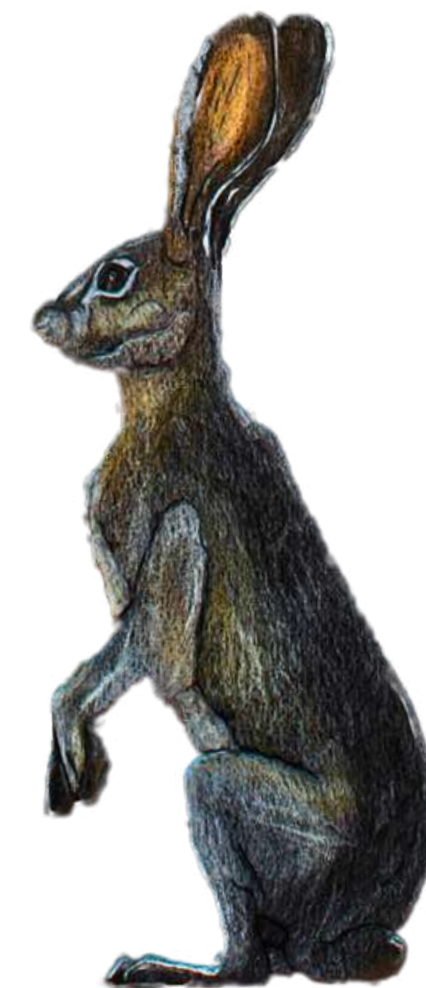
DP1 Augustina Budžiulytė „Kiškių mėgstamos vaistažolės“, lektorė Sigita Grabliauskaitė Spalvoti akvareliniai pieštukai, geliniai tušinukai, 3vnt., 1 vnt - 100 x 35 cm. 2023 m.