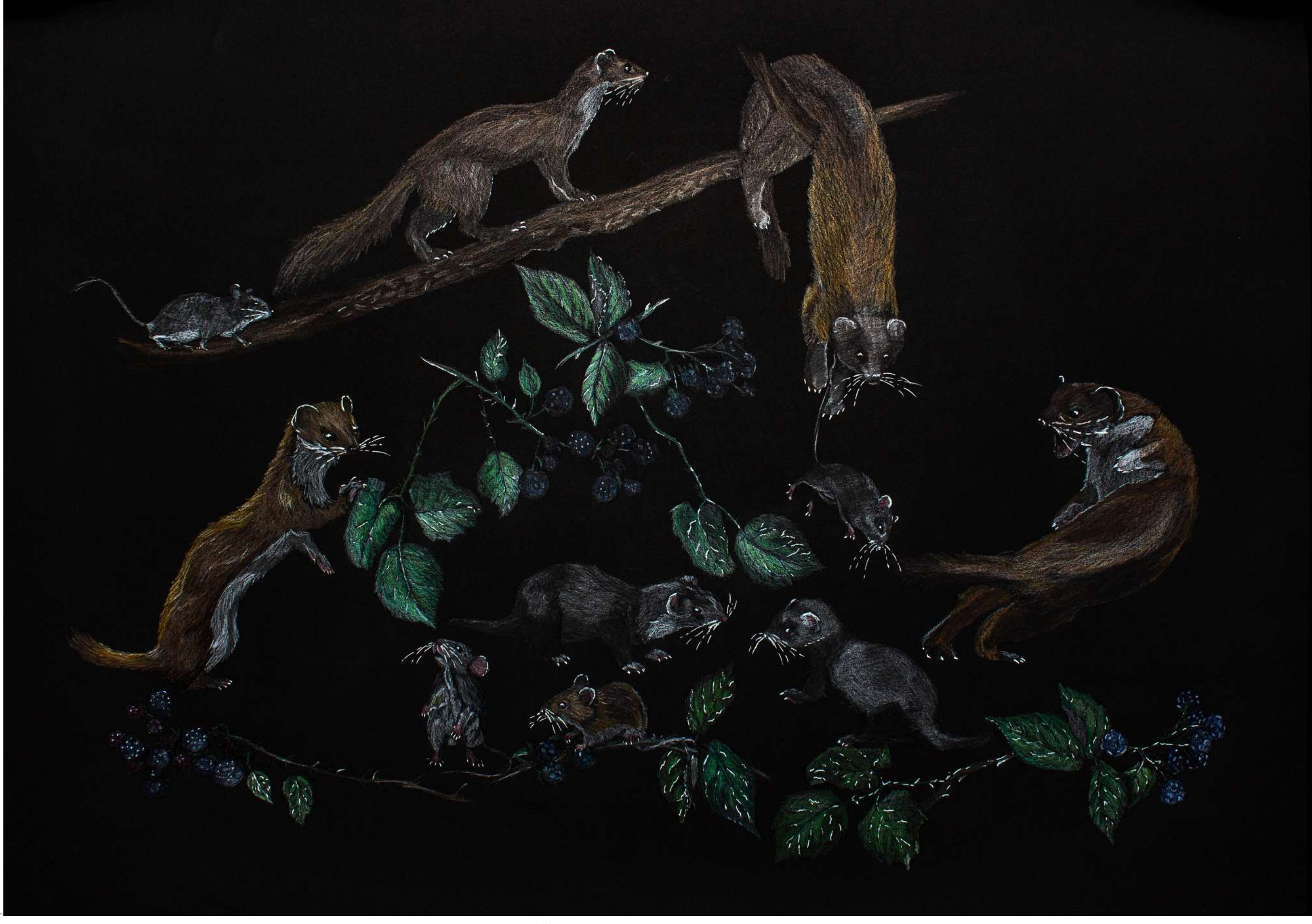
DP1 Laurinta Praščiūnaitė „Žebenkščių smaguriavimai tarp gervuogių“, lektorė Sigita Grabliauskaitė Spalvoti akvareliniai pieštukai, geliniai tušinukai, 70 x 100 cm 2023 m.