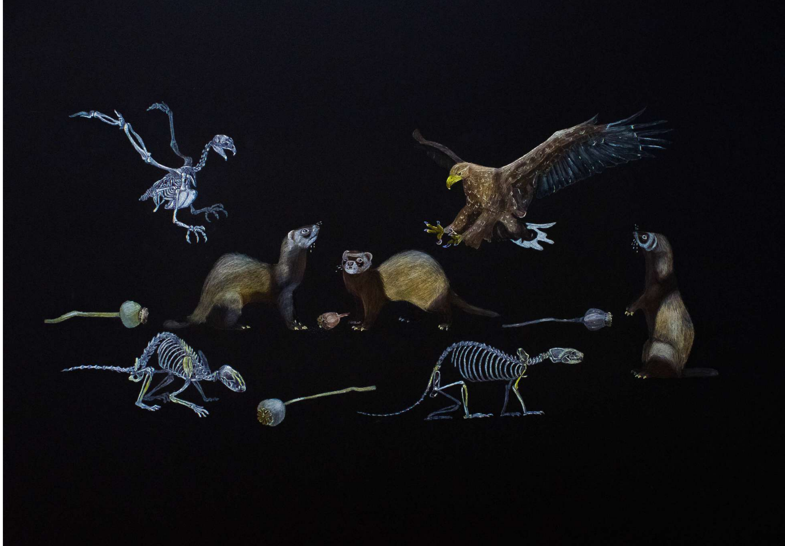
DPO Ugnė Paškevičiūtė „Smalsus kaimiškas gyvenimas menininko akimis“, lektorė Sigita Grabliauskaitė Spalvoti akvareliniai pieštukai, geliniai tušinukai, 70 x 100 cm 2022 m.