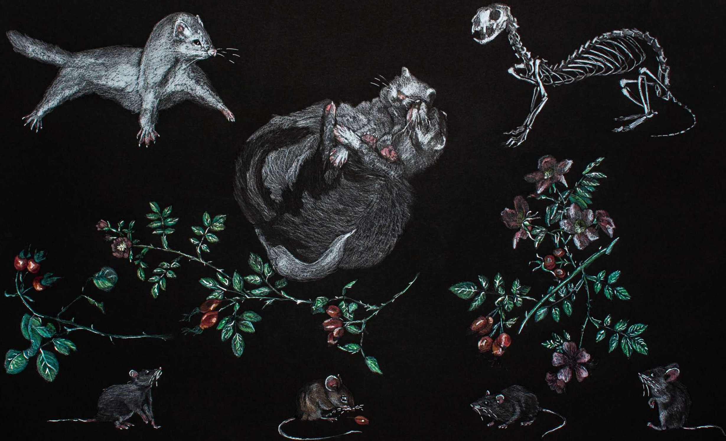
DP1 Laurinta Praščiūnaitė „Šermuonėlių džiaugsmas pavasari tarp erškėtrožių“, lektorė Sigita Grabliauskaitė Spalvoti akvareliniai pieštukai, geliniai tušinukai, 70 x 100 cm 2023 m.