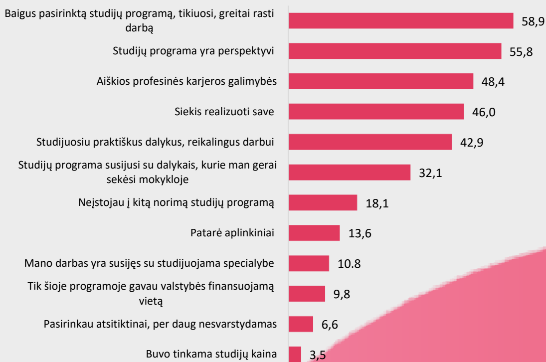
3 pav. I-ojo kurso Medicinos fakulteto studentų, studijų programos, kurioje studijuoja, pasirinkimo motyvai (proc.)

Šiek tiek daugiau nei pusė I-ojo kurso Medicinos fakulteto studentų teigia, jog pasirinko būtent tą studijų programą, kurioje dabar studijuoja, nes baigus studijas, tikisi greitai rasti darbą pagal specialybę (58,9%) bei, kad jų nuomone, studijų programa yra perspektyvi (55,8%) (žr. 3 pav.).