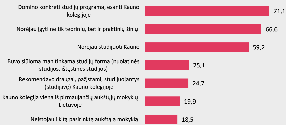
2 pav. I-ojo kurso Medicinos fakulteto studentų Kauno kolegijos, kaip aukštosios mokyklos, pasirinkimo motyvai (proc.)

Trys ketvirtadaliai I-ojo kurso Medicinos fakulteto studentų studijas Kauno kolegijoje pasirinko, nes juos domino konkreti studijų programa (71,1%). Du trečdaliai respondentų atsakė, jog norėjo įgyti ne tik teorinių, bet ir praktinių žinių (66,6) (žr. 2 pav.).