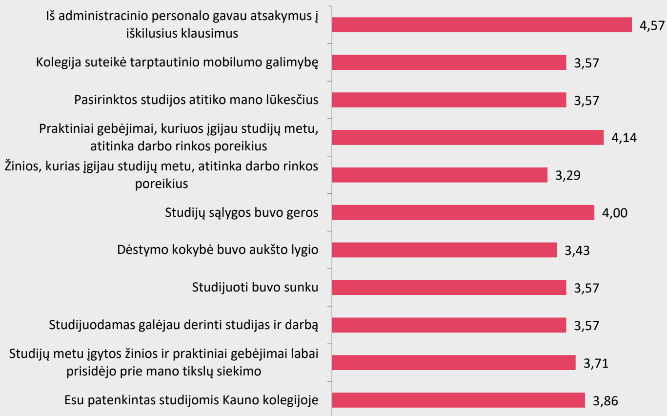
2 pav. Dietetikos studijų programos absolventų nuomonė apie studijas Kauno kolegijoje

Respondentams buvo pateikti teiginiai apie studijas Kauno kolegijoje ir buvo prašoma įvertinti juos nuo „Visiškai sutinku“ – 5 iki „Visiškai nesutinku“ – 1. Gautų duomenų analizė atskleidė, jog respondentai labiausiai sutinka su teiginiu, kad administracinis personalas suteikė atsakymus į iškilusius klausimus. Mažiausiai respondentai sutinka su teiginiu, kad žinios, kurias įgijo studijų metu, atitinka darbo rinkos poreikius (2 pav.)