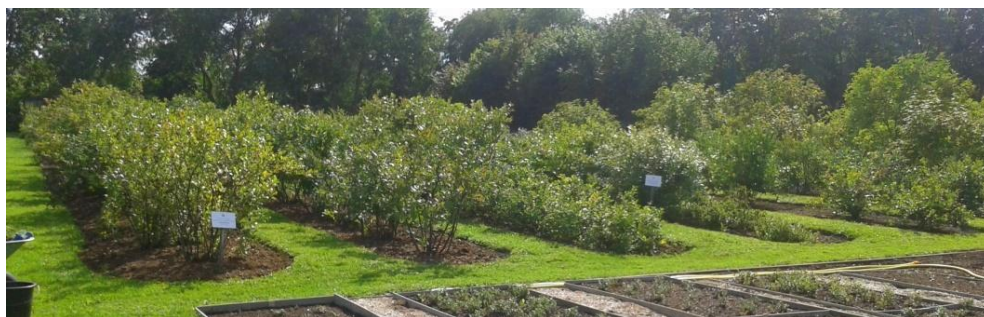
3.1 pav. Šilauogių auginimo bandymų laukeliai